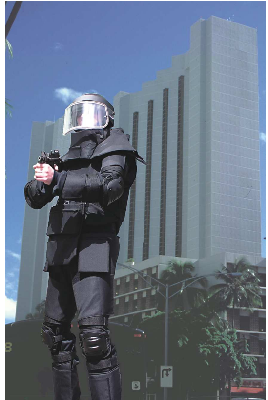
Osobisty Zestaw Kuloodporny nagrodzony w Genewie

ITB „Moratex” jako jedyny wystawca prezentował nowoczesne rozwiązania osobistych osłon balistycznych takich, jak kamizelki i hełmy kuloodporne przeznaczone dla służb konwojowych,